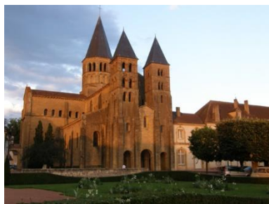
Paray le monial