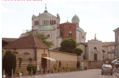
Ars sur formans