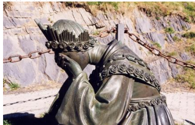
Notre Dame de La Salette